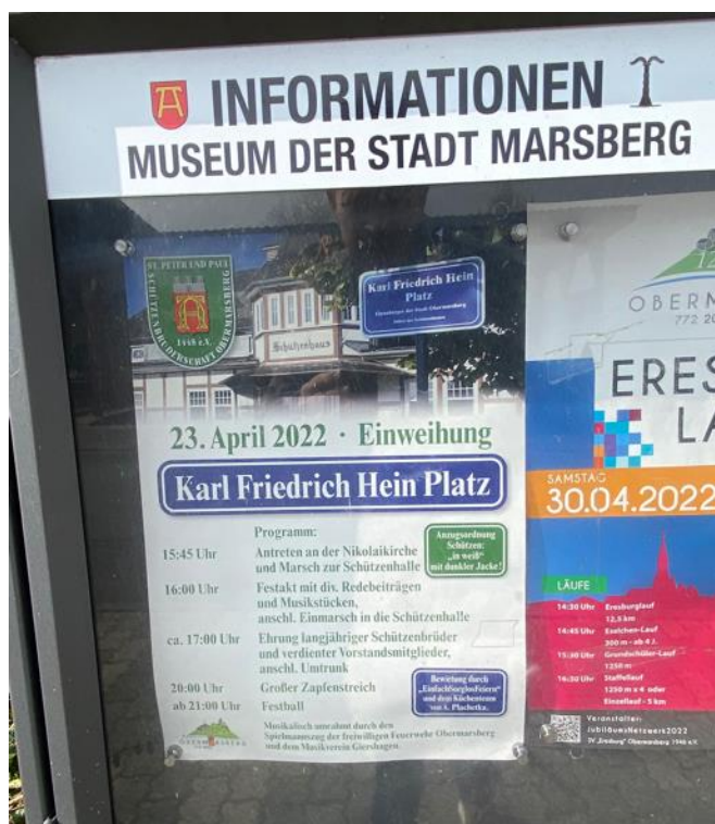
Een feestelijk programma rond de 'Einweihung' van de K.F. Hein Platz

In april 2022 vond eindelijk het geplande feest rond de onthulling van de K.F. Hein Platz in Obermarsberg plaats, als onderdeel van de viering rond 1.250 jaar Marsberg / Obermarsberg. Tijdens deze feestelijke bijeenkomst wordt ook stilgestaan bij het afscheid van Sigurd Born als Protokollant van de Familienkommission .