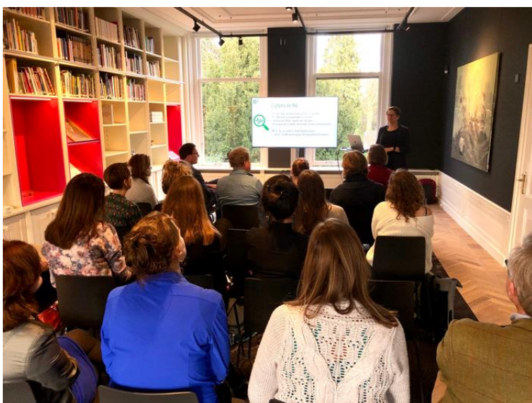
Bijeenkomst Is jouw festival digitaal toegankelijk? in de eigen bibliotheek.

In maart 2020 deed corona zijn intrede. Een aantal geplande bijeenkomsten werd uitgesteld of is in een andere vorm (d.w.z. online) doorgegaan. Zo werd wederom gestart met de workshopserie Friendraising, Relatieontwikkeling en Sponsoring voor culturele organisaties. Een deel van deze serie, gegeven door Charistar, heeft uiteindelijk online plaatsgevonden. Hetzelfde gold voor de succesvolle workshops crowdfunding die het K.F. Hein Fonds samen met het Prins Bernhard Cultuurfonds Utrecht en Voordekunst presenteert: in 2020 vonden die goddeels plaats in de vorm van webinars.